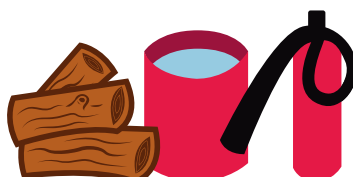
Lenha, água, extintor