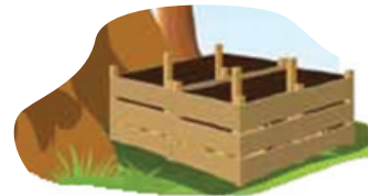
cerca de madeira