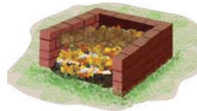
cerca de tijolo